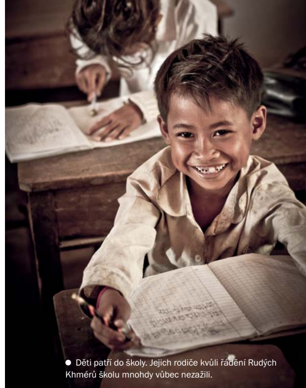
● Děti patří do školy. Jejich rodiče kvůli řadě Rudých Khmérů školu mnohdy vůbec nezažili.

Nebo náš Adonis, co má krásně husté vlasy a ostře řezané obličej. Chtěli byste jeho svaly? Můžete jako on každý den tahat kádě vody na mytí, dřevu na otop a starat se sám o svoji starou nemocnou maminku. A potom si dojít pár kilometrů do školy, která byla postavena díky českým skautům z neziskovky JHP škola. Adonis se tam učí základy práce ▶