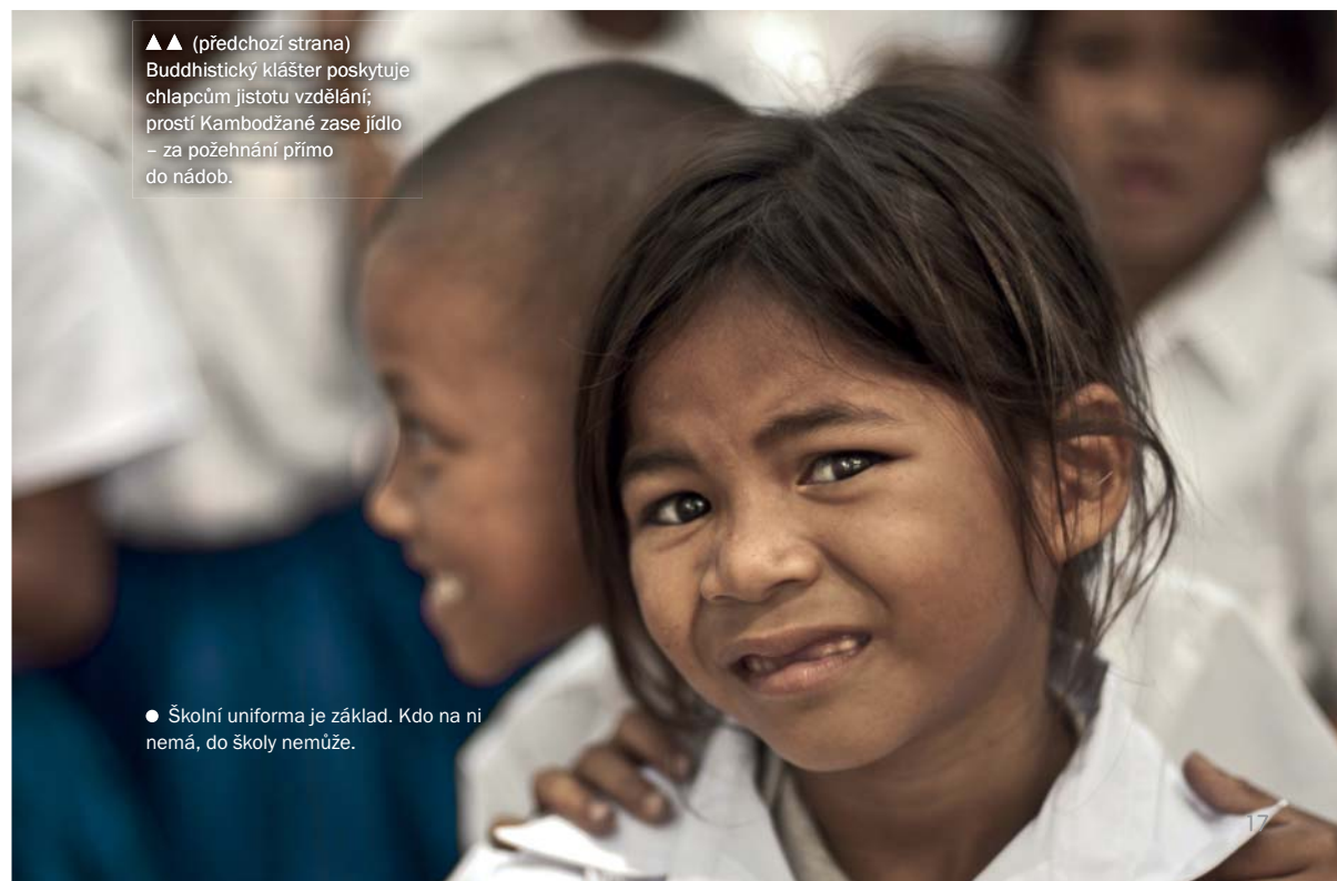
● Školní uniforma je základ. Kdo na ni nemá, do školy nemůže.

▲▲ (předchozí strana) Buddhistický klášter poskytuje chlapcům jistotu vzdělání; prostí Kambodžané zase jídlo – za požehnání přímo do nádob.