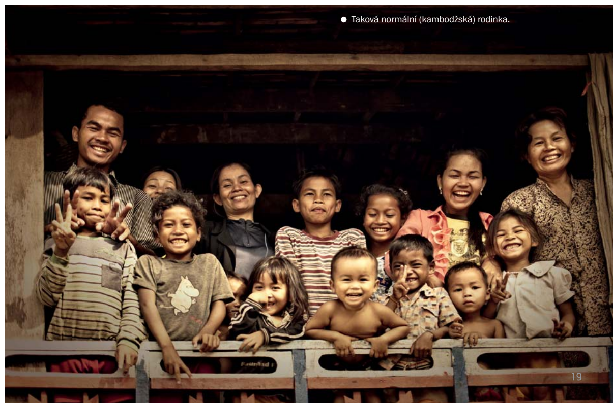
● Taková normální (kambodžská) rodinka.