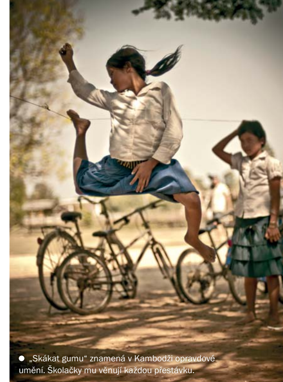
● „Skákát gumu“ znamená v Kambodži opravdové umění. Školačky mu věnují každou přestávku.

▲▲ (předchozí strana) Buddhistický klášter poskytuje chlapcům jistotu vzdělání; prostí Kambodžané zase jídlo – za požehnání přímo do nádob.