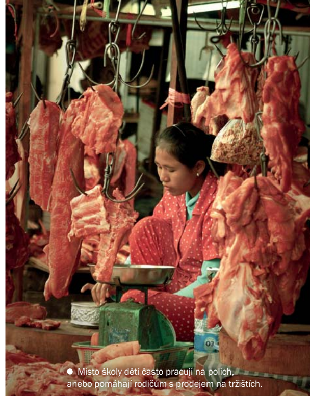
● Místo školy děti často pracují na polích, anebo pomáhají rodičům s prodejem na tržištích.

Náš průvodce sem dojíždí a za pár dolarů od cizí neziskovky učí místní děti anglicky. Opačně by to nešlo: Kambodža de facto nezná hromadnou dopravu. Rodiny ze slumu se kvůli developerskému skupování pozemků uvnitř hlavního města ocitly v pasti. Co na tom, že získaly peníze, jaké nikdy neviděly, a nový pozemek za městem. Dolary mnozí z nich pozbyli tak rychle, jak je nabyli – za poslední koupili třeba televizi, teď paradoxně jejich jediné pouto se světem. Pokud zapomněli na moped anebo aspoň na kolo, jsou odkázáni na slum. Takových je tu většina, ►